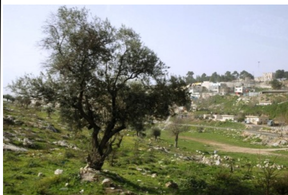
Vue de Bethphagé

Bethphagé est le symbole d'un lieu de vie où on n'atteint pas la maturité, où aucune entre-