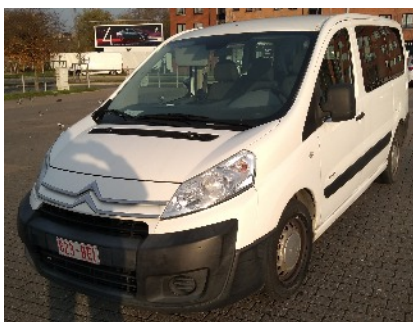
Notre ancien minibus